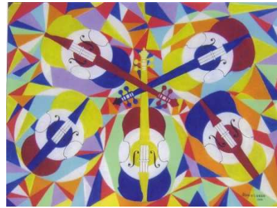
Les Violons d'Arquelin